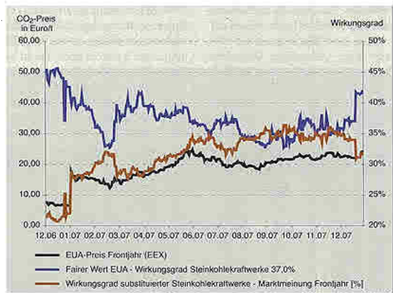
Bild 1: Darstellung mittlerer Wirkungsgrad substituiertes Kohlekraftwerke, gehandelter EUA-Preis und fairer EUA-Wert im Vergleich; Stand 4. Januar 2008